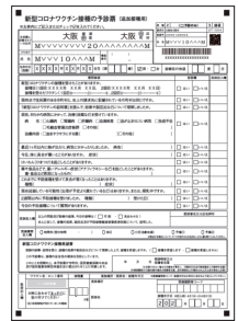
接種券一体型予診票